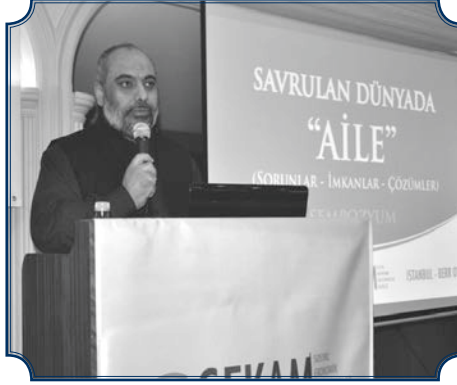
BÜLENT YILDIRIM İHH Genel Başkanı

B öyle bir toplantıda olmaktan dolayı mutluyum. Yeryüzünün birçok noktasına ulaşma imkânına kavuşmuş bir kuruluşun Başkanı olarak öncelikle toplumların neden çöküntüye uğradığını, hatta neden emperyalistlerin sömürgesi altına girdiğini araştırdığımız zaman birçok sebepler sıralanabiliyor. Bizler de kendimize göre buralarda özgürlük adına, direniş adına bu sorunları nasıl çözebiliriz, bunun asıl ilacı nedir diye düşündüğümüzde sonuçta iki meseleye, iki tane çözüme kadar indirebiliyoruz: Bir tanesi sağlıklı bir aile yapısı, yani kiblegâh olması lazım ailelerin, çok sıkıntı anında dahi aileye gideceksiniz, ailenin içerisinde yaşayacaksınız, aile içinde çocuklarınızla beraber olacaksınız. Bu merhameti doğurur, merhametin oluşturduğu topluluklar başkasına zulmedemez. Aile yapısı bozulmuş olan her topluluk ya sömürülür, ya sömürür, başka şansı yok. Üçüncü bir şey bulamazsınız, iyilik adına bir şey de bulamazsınız.